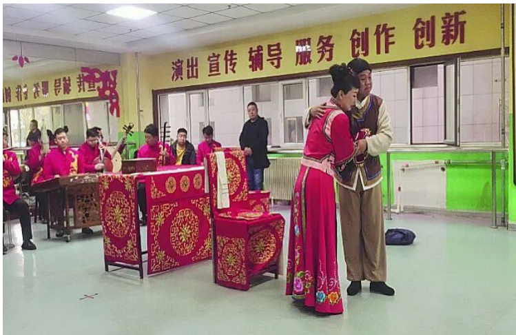
萨拉齐综合文化站居民演出队表演二人台

文化大院和文化站的演出人员多为退休人员或当地民众组成的业余爱好者，其中有从事民间戏班者，在政府提供的场所中，定期排练演出，自主提供乐器，对推动二人台在民间的流传做出了积极贡献，对喜爱二人台的民众们也起到了积极的支持作用。