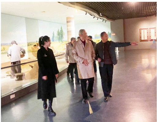
调研期间参观敕勒川博物馆

研究会、西口文化研究会、察哈尔文化研究会、土右旗敕勒川文化研究会。同时，指导5个盟市相关旗县的文化研究工作。